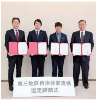
尾三地区自治体間連携協定締結式

公募型プロポーザル方式により事業者を選定した結果、削減効果見込額がより優れていた中部電力ミライズ株式会社と5月29日に契約締結しました。これにより6月から購入単価が引き下げられ、企業団の標準料金に対し約15%年間約590万円の経費削減効果があります。